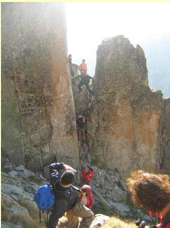
usek na stazi