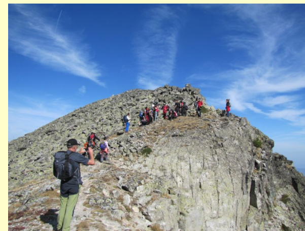
ka vrhu Aleko 2713m

Hvala planini i dragim drugarima planinarima na doprinosu na uspešno sprovedenoj akciji. Budite prirodni u prirodi.