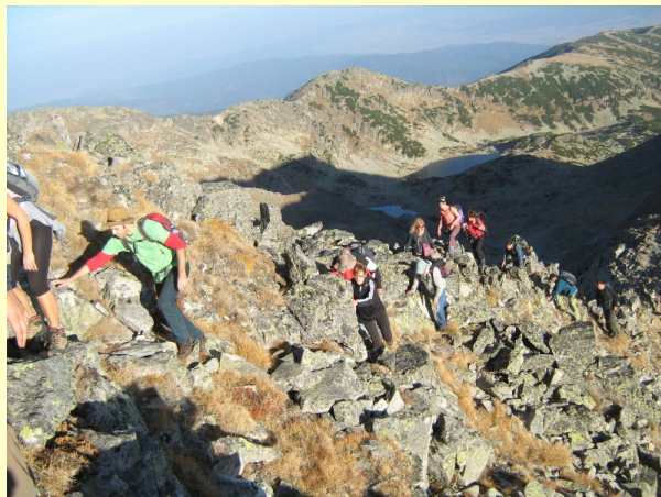
Pod Malom Musalom

Po izraženoj kamenoj stazi dolazimo do pod sledeći vrh Mala Musala (2902m). Pošto staza nije markirana na ovom delu se treba malo više potruditi.