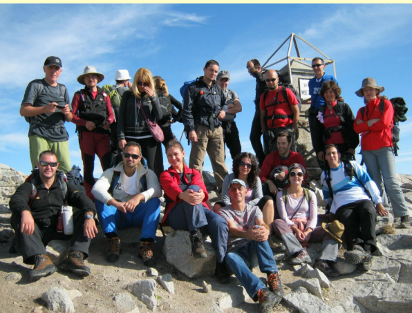
Na vrhu Musala (2925m)

Na najviši vrh Balkana, Musala (2925m) izlazimo u planirano vreme 09.30h..