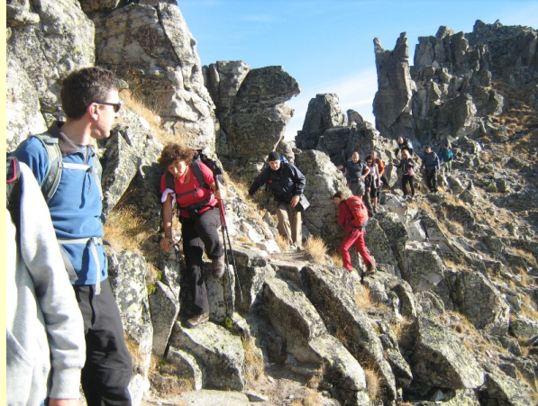
Detalj sa uspona