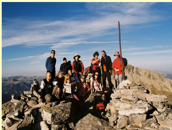
Mala Musala 2902m

Na naše zadovoljstvo vrlo brzo smo bili na vrhu.