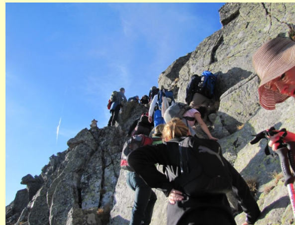
uspon na Malu Musalu