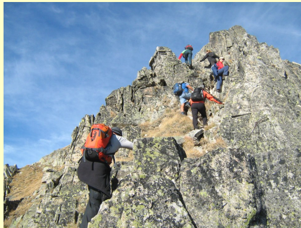
završni uspon na Musalu